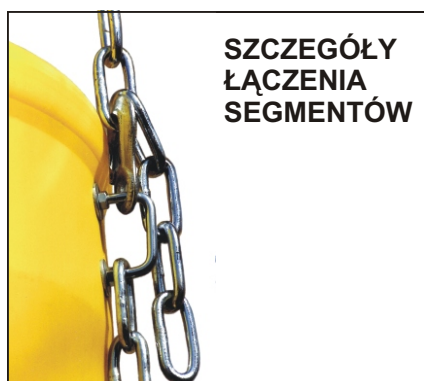
SZCZEGÓŁY ŁĄCZENIA SEGMENTÓW