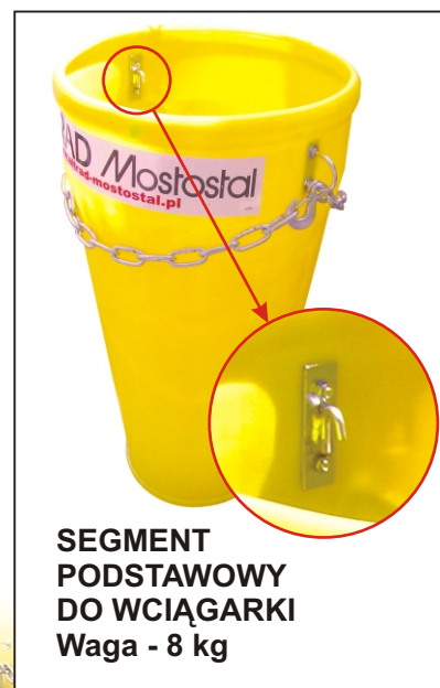
SEGMENT PODSTAWOWY DO WCIĄGARKI Waga - 8 kg