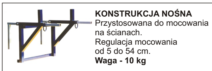
KONSTRUKCJA NOŚNA Przystosowana do mocowania na ścianach. Regulacja mocowania od 5 do 54 cm. Waga - 10 kg