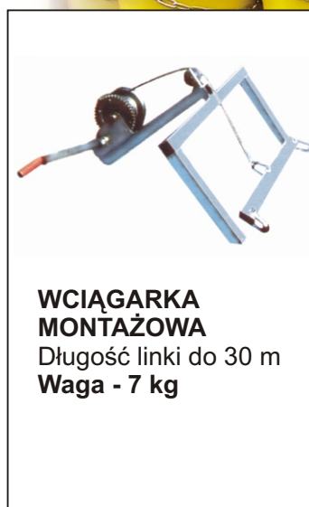
WCIĄGARKA MONTAŻOWA Długość linki do 30 m Waga - 7 kg