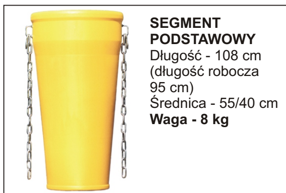
SEGMENT PODSTAWOWY Długość - 108 cm (długość robocza 95 cm) Średnica - 55/40 cm Waga - 8 kg