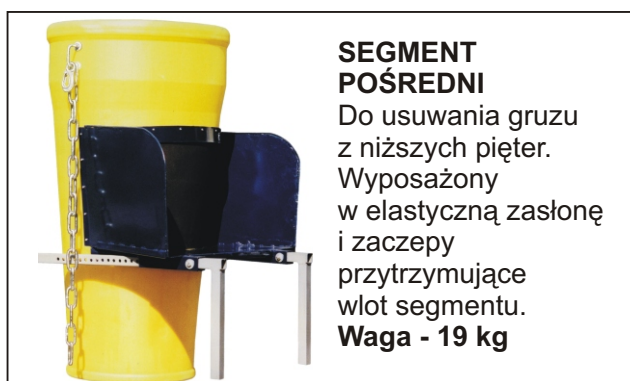
SEGMENT POŚREDNI Do usuwania gruzu z niższych pięter. Wyposażony w elastyczną zasłonę i zaczepy przytrzymujące wlot segmentu. Waga - 19 kg