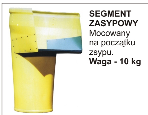
SEGMENT ZASYPOWY Mocowany na początku zsyphu. Waga - 10 kg