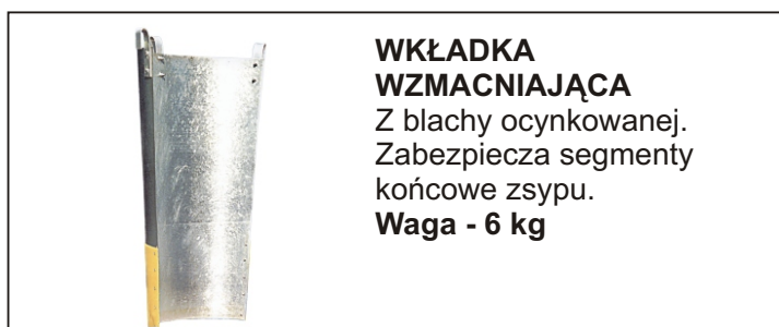
WKŁADKA WZMACNIAJĄCA Z blachy ocynkowanej. Zabezpiecza segmenty końcowe zsyphu. Waga - 6 kg